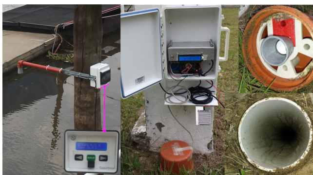
Figura 2. Distanciómetros acústicos: altura hidrométrica (izq.) y nivel freático (der.).

Para la medición del nivel freático se han llevado a cabo dos enfoques, idéntica a la mencionada con anterioridad para altura hidrométrica y utilizando sensores de presión sumergidos. Para el primer caso, se diseñaron con una impresora 3D los complementos necesarios para acoplarlos al extremo superior del tubo de la perforación, cuidando que la visión del sensor sea colineal al tubo. Para el caso del sensor de presión, se utilizó uno diferencial ya que es necesario compensar la presión atmosférica. Para todos los casos se utilizaron sensores digitales 4 cuya comunicación con el datalogger es mediante protocolos I2C, SPI y Serie.