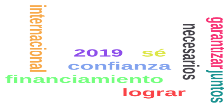
Fig. 4. Palabras más mencionadas del discurso del 29 de Agosto de 2018

La que mayor variación positiva tuvo, fueron las cotizaciones del 28 de Agosto y 29 de Agosto de 2018, donde fue de $ 4,73. En este rango, encontramos un discurso el día 29 de agosto, donde las palabras más mencionadas fueron las que se presentan en la figura 4: