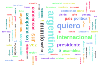
Fig. 5. Palabras más mencionadas del discurso del 26 de Septiembre de 2018

Otra variación importante fue la del 25 al 26 de Septiembre de 2018 donde el cambio fue de $1,31. Podemos encontrar el día 26, un discurso en la Asamblea de Naciones Unidas, en dicho discurso, las palabras más mencionadas fueron las que se observan en la figura 5.