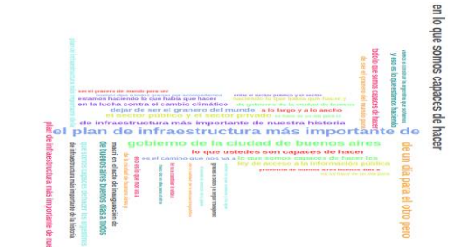
Fig. 3. Ngrams de 7 palabras

En la comparación de los precios de la cotización del dólar, frente a los discursos que fueron dados por el mandatario, podemos hallar la correspondencia que hay entre los discursos en los días que tuvo mayor variación el precio de la divisa. Para ello, se realizó una búsqueda para encontrar los días que tienen mayor variación positiva y negativa, posteriormente se buscaron los discursos que se encuentran dentro de esos periodos. Para obtener la variación, se realizó el remuestreo de los datos como una serie temporal, donde se computaba el día actual y el día anterior, y se realizaba la sustracción para obtener cuánto varió el precio. Posterior a este hallazgo, se buscó si unos días anteriores y posteriores a esa variación se encontraba un discurso.