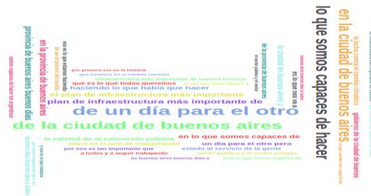
Fig. 2. Ngrams de 6 palabras