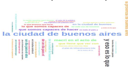
Fig. 1. Ngrams de 5 palabras

como los demás, pero hace referencia a un modismo que posee el presidente para explayarse al momento de conectar ideas. En la figura 1,2 y 3 podemos observar los ngrams que se pueden encontrar en el portal desarrollado para el trabajo.