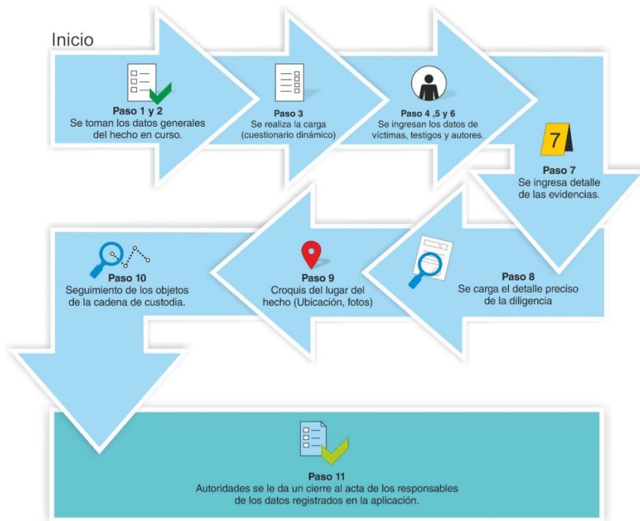
Fig. 1. Flujo de carga de datos dentro de la APP flagracia

Los datos se agruparon en 11 pasos que indican el flujo de carga de la información. En cada paso se incorpora información relacionada a la denuncia, haciendo uso de los sensores y utilidades de un dispositivo móvil, como son la cámara de fotos, el micrófono para la grabación de audios, el almacenamiento interno y el GPS para la georreferenciación.