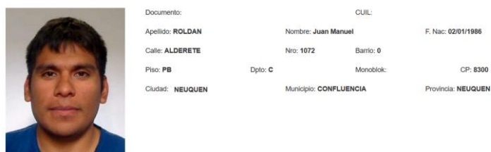
Fig. 3. Datos obtenidos de RENAPER de una persona

Utilizando las directivas de integración provistas por el modelo hacemos uso dentro del sistema de un servicio provisto por el Registro Nacional de la Personas (RENAPER), que nos permite mediante datos básicos de la persona como el documento y el sexo, obtener información de calidad, auditada y de manera segura de dicha persona. Así toda la toma de datos relacionados a personas dentro del sistema (Testigos, Autores, Víctimas) se completa y valida mediante este servicio, facilitando y asegurando que la carga de datos sea correcta.