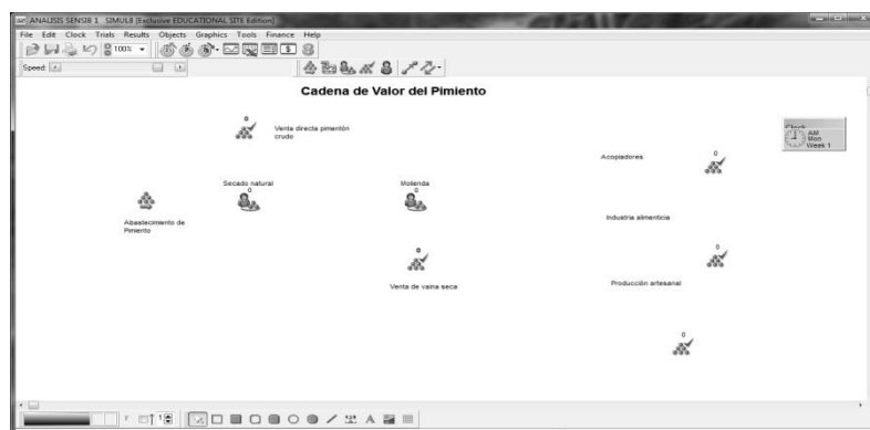
Fig. 3. Cadena de Valor del Pimiento procesado al 100 %

El cambio que se propone es el procesamiento del porcentaje total de pimiento fresco, sin venta directa, según puede verse en la Figura 3: